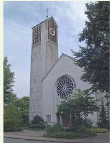
St. Meinolf, Bielefeld