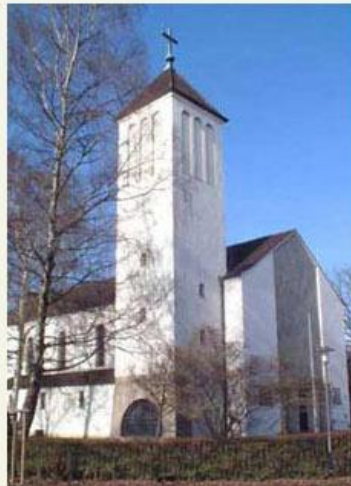
St. Hedwig, Heepen