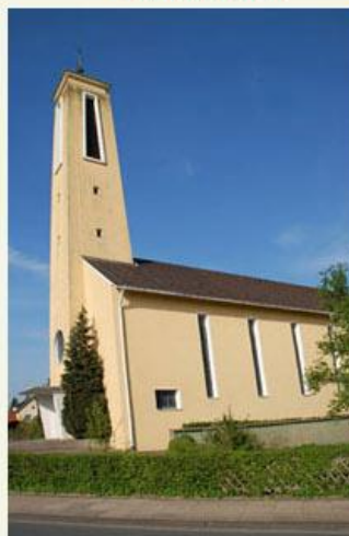
Heilig Kreuz, Brake