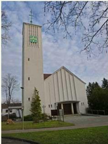
St. Bonifatius, Stieghorst